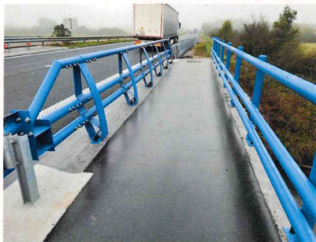
Ouvrage nord réalisé en 2023